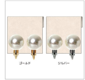
色展開 兼 台紙