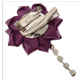
背面 兼 留め具