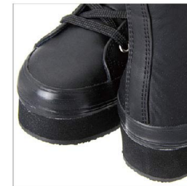
特徴部分 兼 素材感