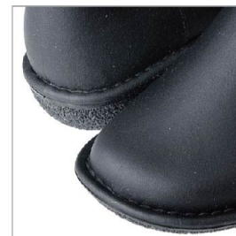
特徴部分 兼 素材感