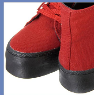
特徴部分 兼 素材感