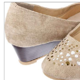
特徴部分 兼 素材感