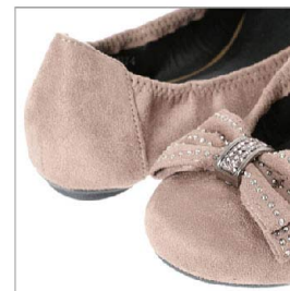
特徴部分 兼 素材感