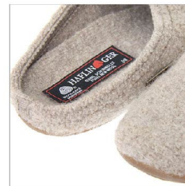
特徴部分 兼 素材感