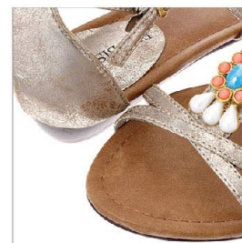
特徴部分 兼 素材感