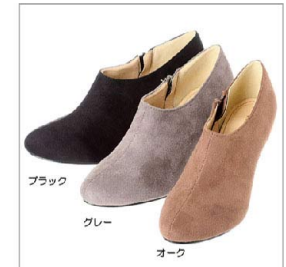
色展開 ブラック グレー オーク