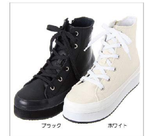
色展開 ブラック ホワイト