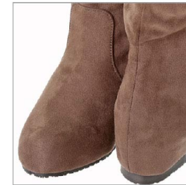
特徴部分 兼 素材感