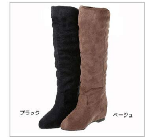
色展開 ブラック ベージュ