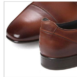
特徴部分 兼 素材感