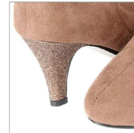
特徴部分 兼 素材感