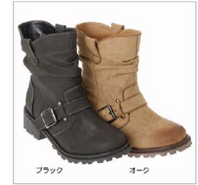
色展開 ブラック オーク