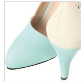
特徴部分 兼 素材感