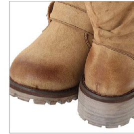
特徴部分 兼 素材感