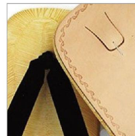
特徴部分 兼 素材感