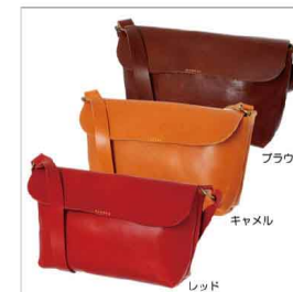
色展開 レッド ブラウン キャメル