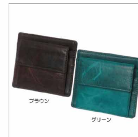
色展開 ブラウン グリーン