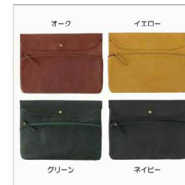
色展開 オーク イエロー グリーン ネイビー