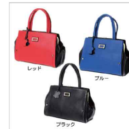
色展開 レッド ブルー ブラック