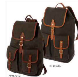
ブラウン キャメル