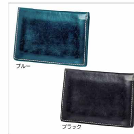
色展開 ブルー ブラック