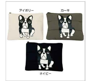
色展開 アイボリー カーキ ネイビー