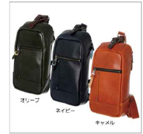
色展開 オリーブ ネイビー キャメル