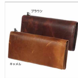
色展開 ブラウン キャメル