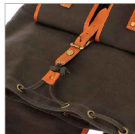
特徴部分 兼 素材感