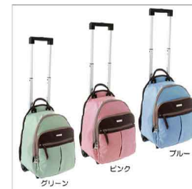
グリーン ピンク ブルー