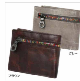
色展開 グレー ブラウン