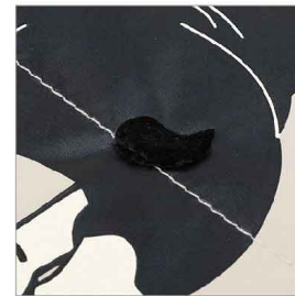
特徴部分 兼 素材感