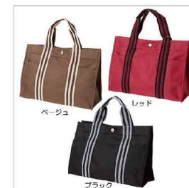
色展開 ベージュ レッド ブラック