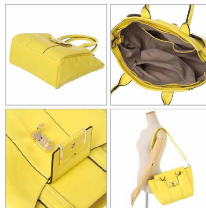
3. 特徴部分・素材感

正面・背面では確認できない底面・内側は、質感が分かるように、特徴部分を撮影します。手に持ったり肩に掛けたカットを追加するとサイズ感が伝わりやすくなります。