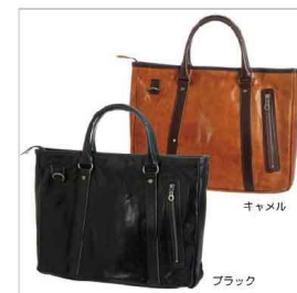
ブラック キャメル