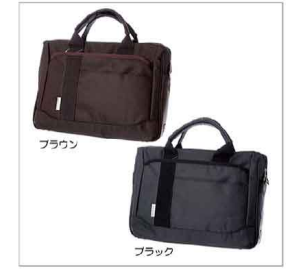
色展開 ブラウン ブラック