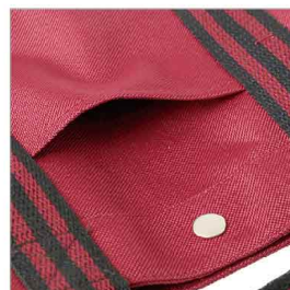
特徴部分 兼 素材感