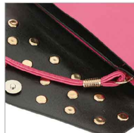
特徴部分 兼 素材感