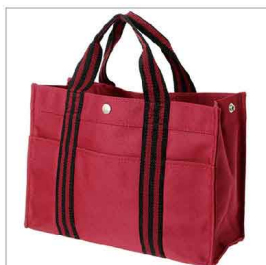
背面 + 変形