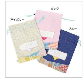
色展開 ピンク ブルー アイボリー