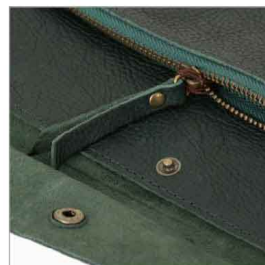
特徴部分 兼 素材感