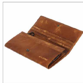
特徴部分 兼 素材感