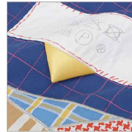
特徴部分 兼 素材感